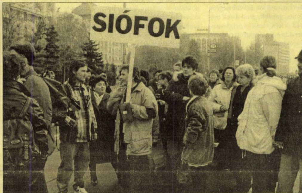
Előbb az egészségügyben dolgozók, majd a pedagógusok szerveztek országos megmozdulást Budapesten. Siófokról mindkét eseményen részt vettek a dolgozók küldöttei. Bővebbet a két eseményről a 8. oldalon olvashatnak.

Lezárult a koncessziós pályázat, amelyet az M 7-es autópálya továbbépítésére írtak ki. Három ajánlat érkezett, amelyek értékelésére várhatóan a jövő év elején kerül majd sor.