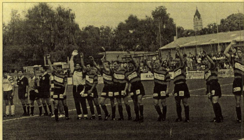
A mérkőzés előtt a siófoki focisták még nem tudták, hogy hamarosan az "őszi legizgalmasabb mérkőzésén", tíz emberrel, az utolsó nyolc percben egyenlítettek ki 0-3-ról Kaposváron, a Rákóczi otthonában.