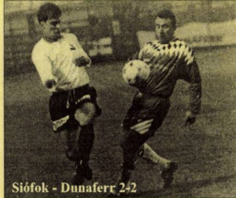
Siófok - Dunaferr 2-2

– Nálam az nem fordulhat elő, hogy a közönség akaratyengésé miatt kifütyüli a csapatot, vagy ugyanezokból egy játékos lecserélését követeli - mondta még a nyáron, Siófokra érkezését követően Keszei Ferenc, aki a nagykanizsai család után feltöltődni, vizsgáztatódni érkezett a Balaton partjára.