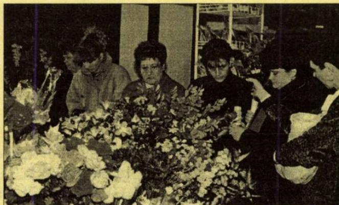
A Zöldfok kertészeti kedvezményes Erzsébet- és Katalin-napi virágvasárt rendezett a DBKK-ban.