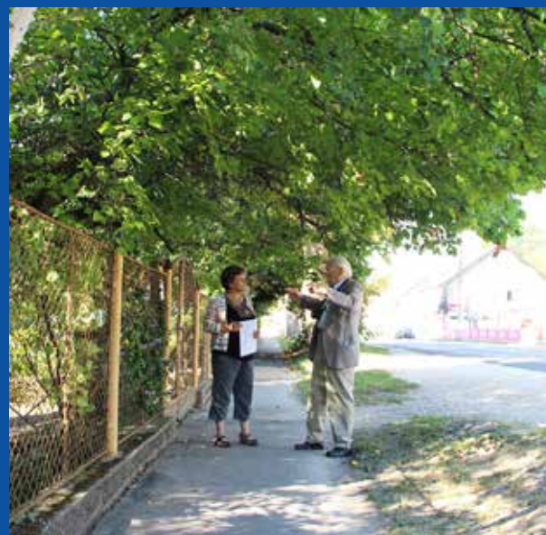
Fő utca 254, a turzágáton. A mai Fő utca csak 300 éve létezik, előtte a Balaton hullámozott itt