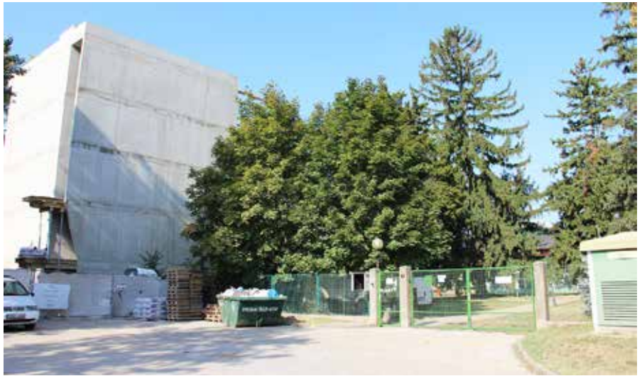
Az épülő apartmanház a meteorológia bejárata felől

A meteorológus szakemberek már évekkal ezelőtt „megnyomták a