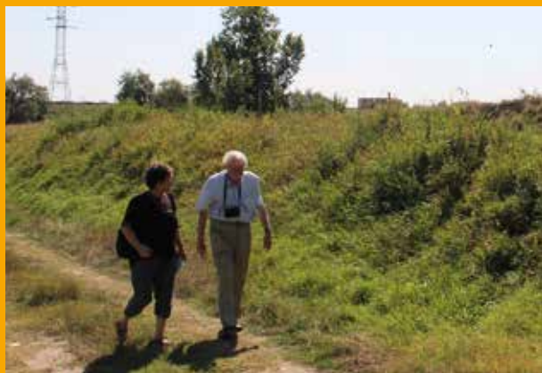
Fok (korábban Lusta) falu dombja ma, háttérben az M7-es

A közelgő városnap (idén november 26.) apropóján foglaljuk össze, mit tudhatunk Faragó Sándor könyvéből arról az időről, amikor Fok 1705-ben a mai városcímer alapjául szolgáló pecsétet kapta II. Rákóczi Ferentől.