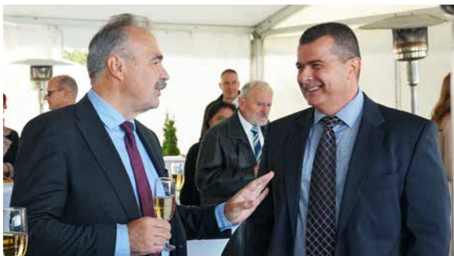
Az agrárminiszter és a polgármester

A hatvanas években még nem gondolták, hogy egyszer milyen értékes lesz az az ezüstparti vízparti terület a befektetők szemében, ahová akkor a kor színvonalának megfelelő öntözőrendszer szivattyútelepét építették. A széplaki városrésztől délre eső területen régóta folyik gyümölcsstermesztés. A Cinege-patak mellett a 60-as évek végén alakították ki a szivattyútelepet, ahonnan csővezetékrendszeren keresztül nyomatták és nyomatják ma is a Balaton-vizet a gyümölcsöt termő földekre. Öntözésre régen is szükség volt, de ma már talán még inkább, hiszen egyre aszályosabb az időjárás (ma már jóval kevesebb az ültetvény, mint akár csak egy-két évtizede is). Az elmúlt időszakban befektetők próbálták kivásárolni a szivattyútelep területét a tulajdonos Gyümölcsstermesztő Zrt.-től,