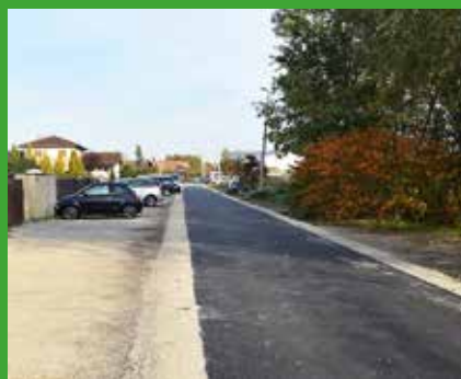
Megújult az Erdei Ferenc utca.

Készülnek a tervek a Baross híd és Vitorlás utcai körforgalom közötti, jelenleg murvás parkoló szilárd burkolatúvá történő átépítésére. A jövő nyárra megszüntetné a város az egyik szegyenfoltját, rendbe tétetné a valahai Csárdás étterem mögötti sétányt. A terveket az önkormányzat szakértői grémiuma, azaz a tervtanács már véleményezte, a tervező e javaslatokkal kiegészíti elképzelését, így alakul ki a Kálmán Imre sétány keleti szakaszának végső képe.